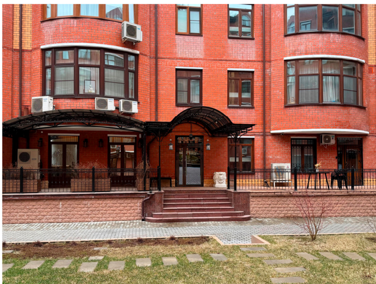
Фото 6. Общий вид фасадов внутреннего контура