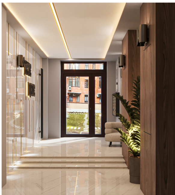
Фото 1. Вид изнутри подъезда